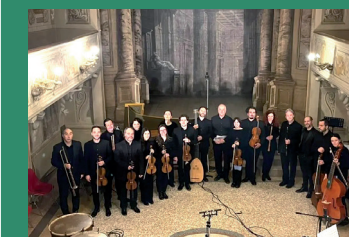
Orchestra Barocca di Bologna