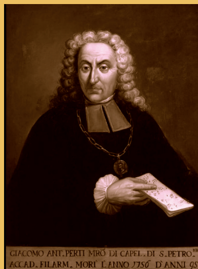
Giacomo Antonio Perti