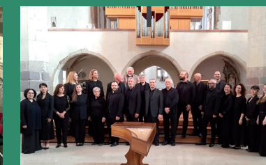
La Stagione Armonica