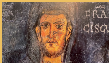
San Francesco d'Assisi