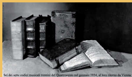
Sei dei sette codici musicali trentini del Quattrocento nel gennaio 1934, al loro ritorno da Vienna

JOHANNES PULLOYS (14..?-1478) Vidi mappamundum contrafactum super Pour prison Tr90 f.297