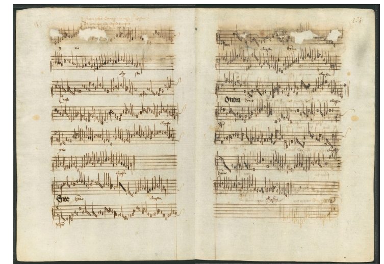
Tr 88 - Kyrie (Tr 88, cc. 276v-277r)