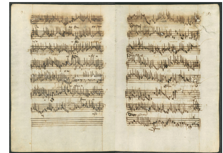
Tr 88 - Sanctus (cc. 281v-282r)